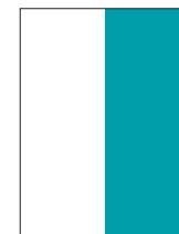
1/2 V 10,2 cm x 27,5 cm (11,2 cm x 28,5 cm s obrezom)