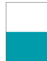
1/2 H 21 cm x 13,7 cm (22 cm x 14,7 cm s obrezom)