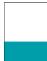
1/3 H 21 cm x 9,1 cm (21,5 cm x 10,1 cm s obrezom)